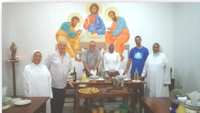
I missionari Fidei Donum in Brasile